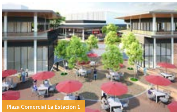
Plaza Comercial La Estación 1