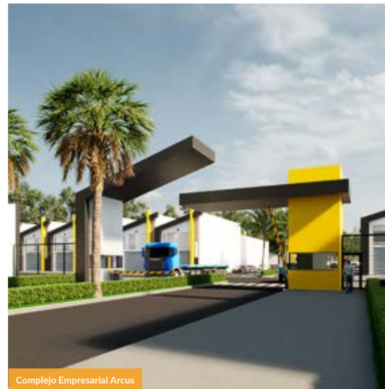
Complejo Empresarial Arcus