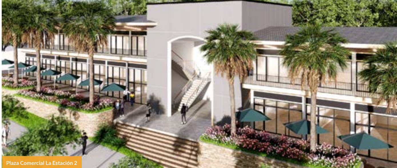
Plaza Comercial La Estación 2

Ambiansa: más que viviendas, un nuevo estilo de vida próspero, seguro y socialmente integrado.